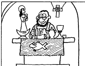
C Die Madonna auf dem Altar