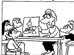
B Die Leiterin einer Gruppe von Erstkommunionkindern